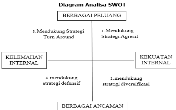
Gambar 26 Diagram Analisa SWOT

Analisa SWOT merupakan strategi managerial yang dikembangkan untuk menjamin sebuah organisasi memiliki daya tahan dan daya hidup di masa depan. Hasil dari penelitian menunjukkan bahwa penentuan kinerja organisasi dipengaruhi oleh kombinasi faktor eksternal dan internal. Faktor internal terdiri dari kekuatan (strength) dan kelemahan (weakness). Faktor eksternal terdiri dari peluang (opportunity) dan ancaman (threat). Analisa SWOT membandingkan antara faktor internal dan eksternal.