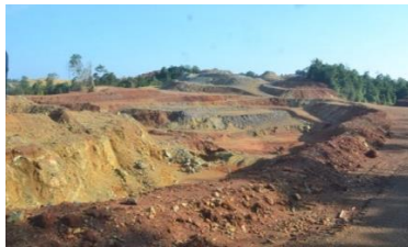
b) Bekas galian tambang

Gambar VI.1. Kondisi Bekas Galian Tambang nikel di Lokasi Pertambangan