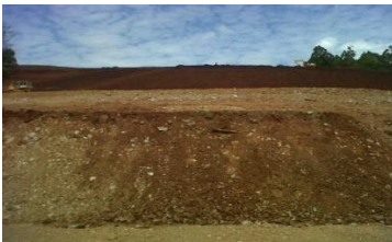
a) Lokasi Penimbunan Top soil

Penambangan secara terbuka cenderung meninggalkan lubang atau cekungan pada akhir penambangan. Berdasarkan hasil pengamatan di lapangan terdapat lubang bekas tambang kedalaman berkisar antara 8–25 meter. Upaya yang dapat dilakukan untuk mengatasi keberadaan lubang-lubang bekas galian tersebut antara lain dengan menutup lubang-lubang bekas galian tersebut dengan mengembalikan kembali susunan komponen tanah sesuai dengan susunan awalnya. Pengembalian tanah tersebut sangat berpengaruh penting untuk kesuburan tanaman (Nurwaskito, 2009).