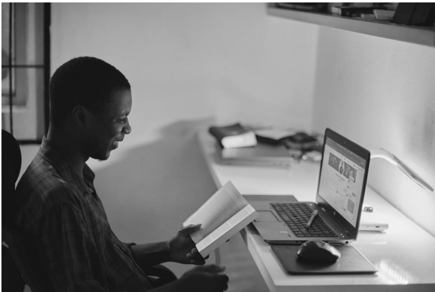
Gambar 11 Internet telah mengubah berbagai aspek kehidupan manusia hingga memiliki dampak pada kesehatan mental

Pada beberapa aspek, teknologi internet memiliki berbagai keuntungan dalam kehidupan individu. Berbagai proses dan aktivitas dapat dengan mudah dilakukan melalui bantuan internet. Bahkan untuk kegiatan yang sebelumnya hanya dapat dilakukan secara tatap muka/langsung saat ini dapat dipermudah dengan adanya teknologi internet.