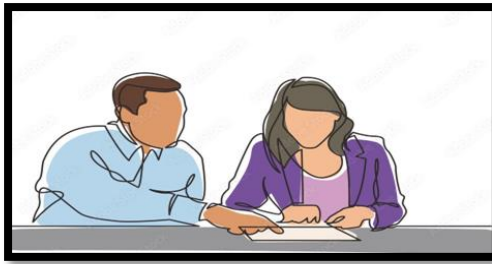
Gambar 11. Pengawasan peningkatan pendidikan