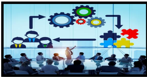
Gambar 14. Pengorganisasian manajemen pendidikan