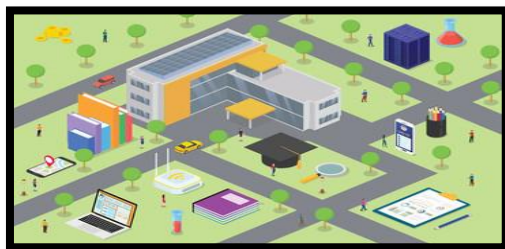
Gambar 9. Sarana prasarana sebagai penunjang pendidikan