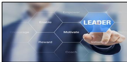
Gambar 3. Manajemen kepemimpinan strategi mencapai tujuan