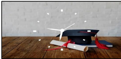
Gambar 1. Tolok ukur manajemen

Pendidikan sebagai wadah mengelola ilmu pengetahuan, kemampuan, dan keterampilan dari proses pembelajaran bagi setiap individu. Karena, manusia sebagai leader di alam dunia ini yang harus memiliki kemampuan dalam menjaga dan melestarikan kehidupan yang diamanatkan oleh Tuhan Yang Maha Esa. Harapannya adalah melalui manajemen pendidikan manusia memiliki pengelolaan yang baik pada setiap lini kehidupan. Perkembangan, kemajuan ilmu pengetahuan dan teknologi merupakan faktor terpenting yang mengharuskan manusia mengembangkan, mengelola serta mengatur keadaan dunia melalui pendidikan dan keilmuannya, agar mampu beradaptasi dengan dunia yang mengalami kemajuan, perkembangan ilmu pengetahuan maupun teknologi modern.