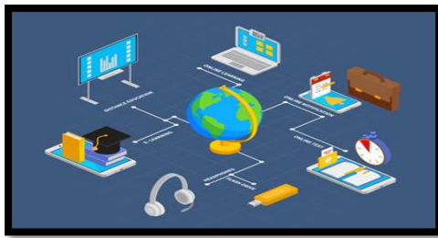
Gambar 12. Sarana pelayanan pendidikan