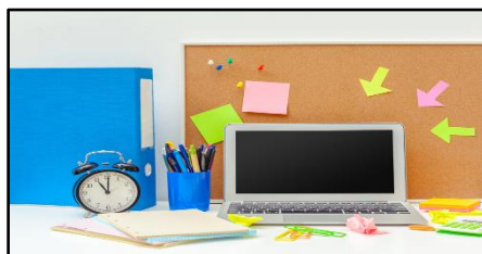
Gambar 4. Strategi peningkatan mutu pendidikan