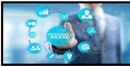
Gambar 10. Aktivitas komunikasi lembaga pendidikan

Peranan Humas (hubungan masyarakat) atau public relations sangat dibutuhkan oleh semua bentuk organisasi (lembaga), bersifat komersial maupun tidak komersial dan perusahaan industri, organisasi sosial budaya hingga pemerintahan. secara garis besar humas merupakan salah satu ujung tombak dari suatu organisasi. Bagi sebuah organisasi, humas sangat diperlukan untuk menjalin komunikasi dengan para stakeholder mengkomunikasikan visi, misi, tujuan, dan program organisasi kepada publik.