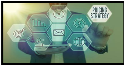
Gambar 8. Faktor mutu capaian tujuan pendidikan