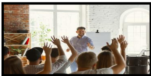
Gambar 7. Peran pendidik dalam mengelola partisipan didik