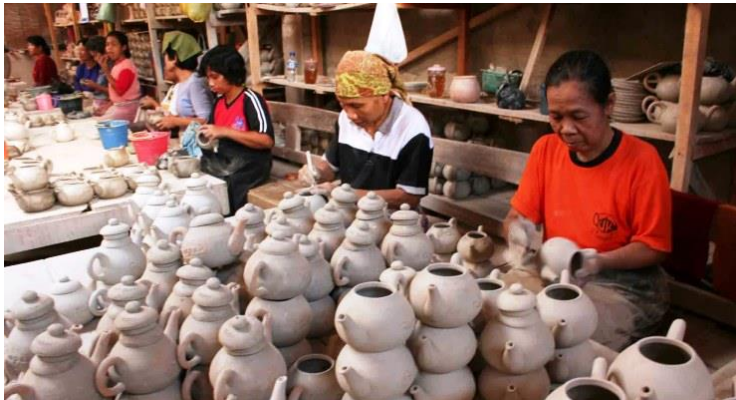
Gambar 1.1 UMKM Gerabah di Indonesia.