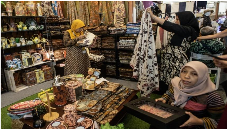
Gambar 2.1 UMKM Batik di Indonesia