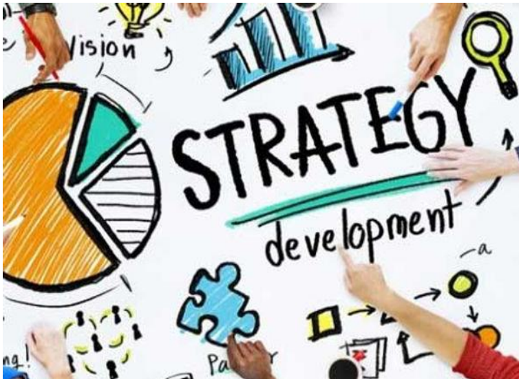
Gambar 5.1 Strategi Pelayanan