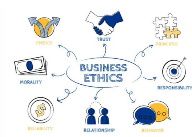
Gambar 3.1 Etika bisnis