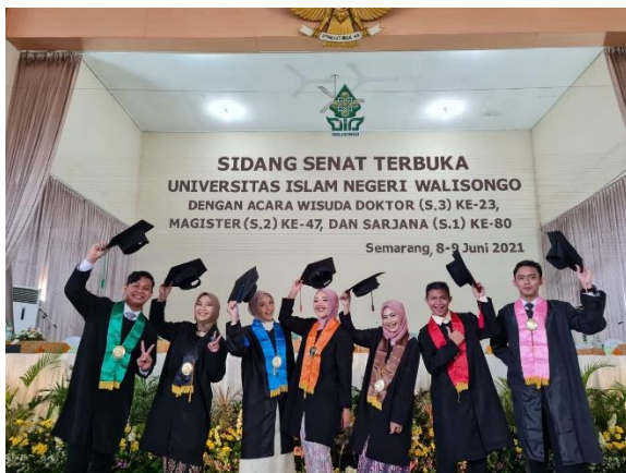
Gambar 6.1 Para wisudawan dan wisudawati UIN Walisongo Semarang.