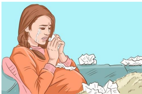
Gambar 5. 1 Animasi Depresi Ibu Hamil

Depresi merupakan gangguan mood yang muncul pada ibu atau Wanita yang sedang hamil. Hampir 10% wanita hamil mengalami depresi berat atau ringan dan depresi sering terjadi dalam trimester pertama. Ciri-ciri ibu hamil yang mengalami depresi ialah adanya perasaan sedih atau perubahan kondisi fisiknya, kesulitan berkonsentrasi akibat jam tidur yang terlalu lama atau sedikit, hilangnya minat dalam melakukan aktivitas yang biasa digemari ibu, putus asa, cemas, timbul perasaan tidak berharga dan bersalah, merasa sedih, menurunnya nafsu makan.