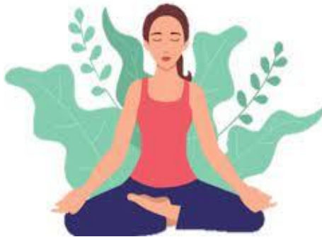
Gambar 2. 1 Animasi Relaksasi

Relaksasi adalah suatu tindakan pengurangan tekanan mental, fisik dan emosi melalui suatu aktivitas dengan tujuan tertentu yang dapat menenangkan pikiran dan fisik seseorang. Relaksasi merupakan salah satu bagian dari terapi nonfarmakologis, yaitu complementary and alternative therapies (CATs) yang dikelompokkan ke dalam Mind-body and spiritual therapies .