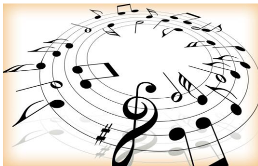
Gambar 1. 1 Animasi Musik Instrumental

Musik adalah bunyi atau nada yang menyenangkan untuk didengar. Musik dapat keras, ribut, dan lembut yang membuat orang senang mendengarnya. Musik adalah karya seni berupa lagu atau hanya bunyi-bunyian yang merupakan bentuk ungkapan perasaan dari pencipta melalui unsur-unsur seni seperti irama, melodi, harmoni, ekspresi. Orang cenderung untuk mengatakan indah terhadap musik yang disukainya. Musik ialah bunyi yang diterima oleh individu dan berbeda bergantung kepada sejarah, lokasi, budaya dan selera seseorang. Teknik relaksasi musik adalah suatu terapi kesehatan menggunakan musik dimana tujuannya adalah untuk meningkatkan atau memperbaiki kondisi fisik, emosi, kognitif dan sosial bagi individu dari berbagai kalangan usia.